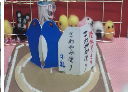
芸人サンドウィッチマンさんが作った力士も！

身体検査 力士のルールに合っているか検査をします。 しんたいけんさ 身長が大きい、足が長い場合は修正(カット)をさせていただきます。 ※修正できない、自分で立てない場合は残念ながら失格となります。